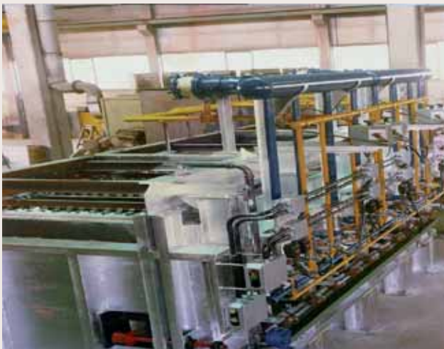
Forni a passo Pellegrino per barre in acciaio fino a 1100°C Walking beam furnaces for steel bars up to 1100°C