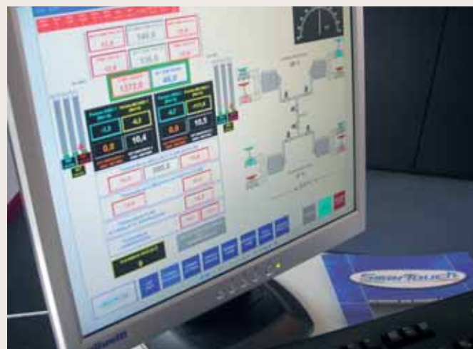
Controllo degli impianti tramite interfaccia grafica per l'operatore Plant control using HMI system