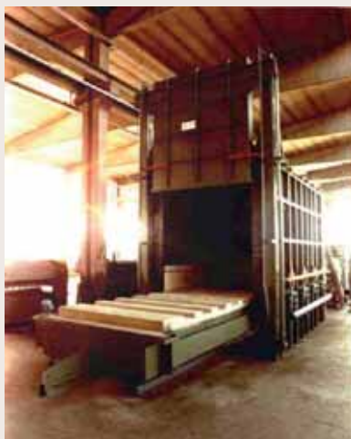
Forni a carro per acciaio fino a 1100°C Car loading furnaces for steel up to 1100°C