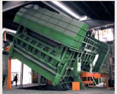
Forni a bacino, fissi e ribaltabili fino a 120 tonnellate - Fixed and tilting furnaces up to 120 tons