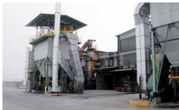
Impianti aspirazione e depurazione fumi Aspiration and filtering systems