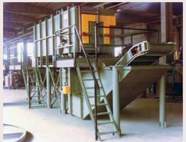
Forno per tempra di acciaio Tempering furnace for steel