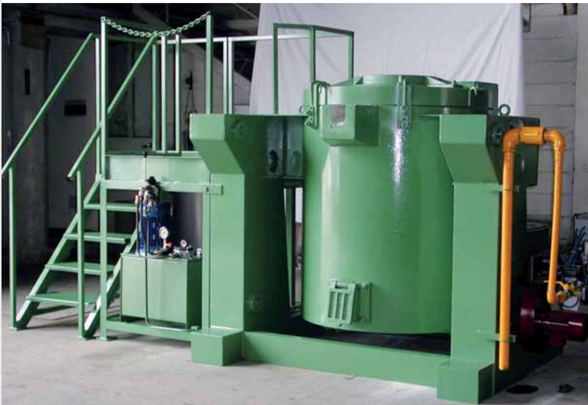
Forni a crogiolo fissi e ribaltabili Fixed and tilting pot furnaces