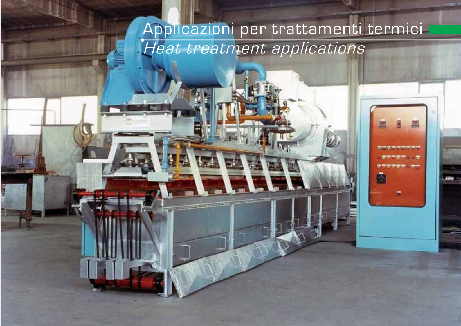
Forno per piastre batterie al Pb - Furnace for Pb accumulator plates