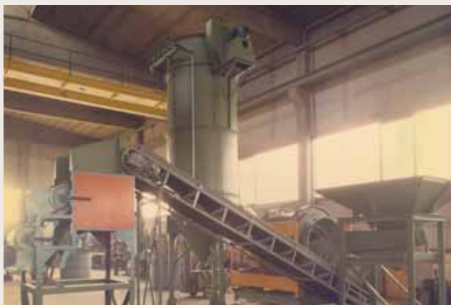
Impianti macinazione rottami Dross milling equipment