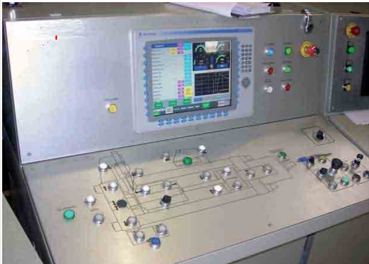
Quadri elettrici, automazione e software per il controllo degli impianti Electrical cabinets, automation and software for equipment control