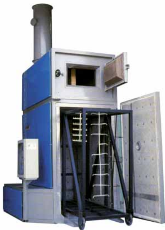
Forno di sverniciatura Furnace for paint removing