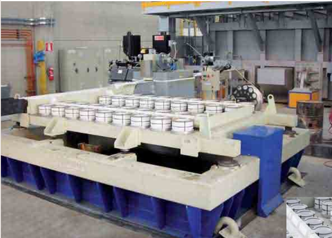
Linea colata billette e lingotti Logs & ingots casting line