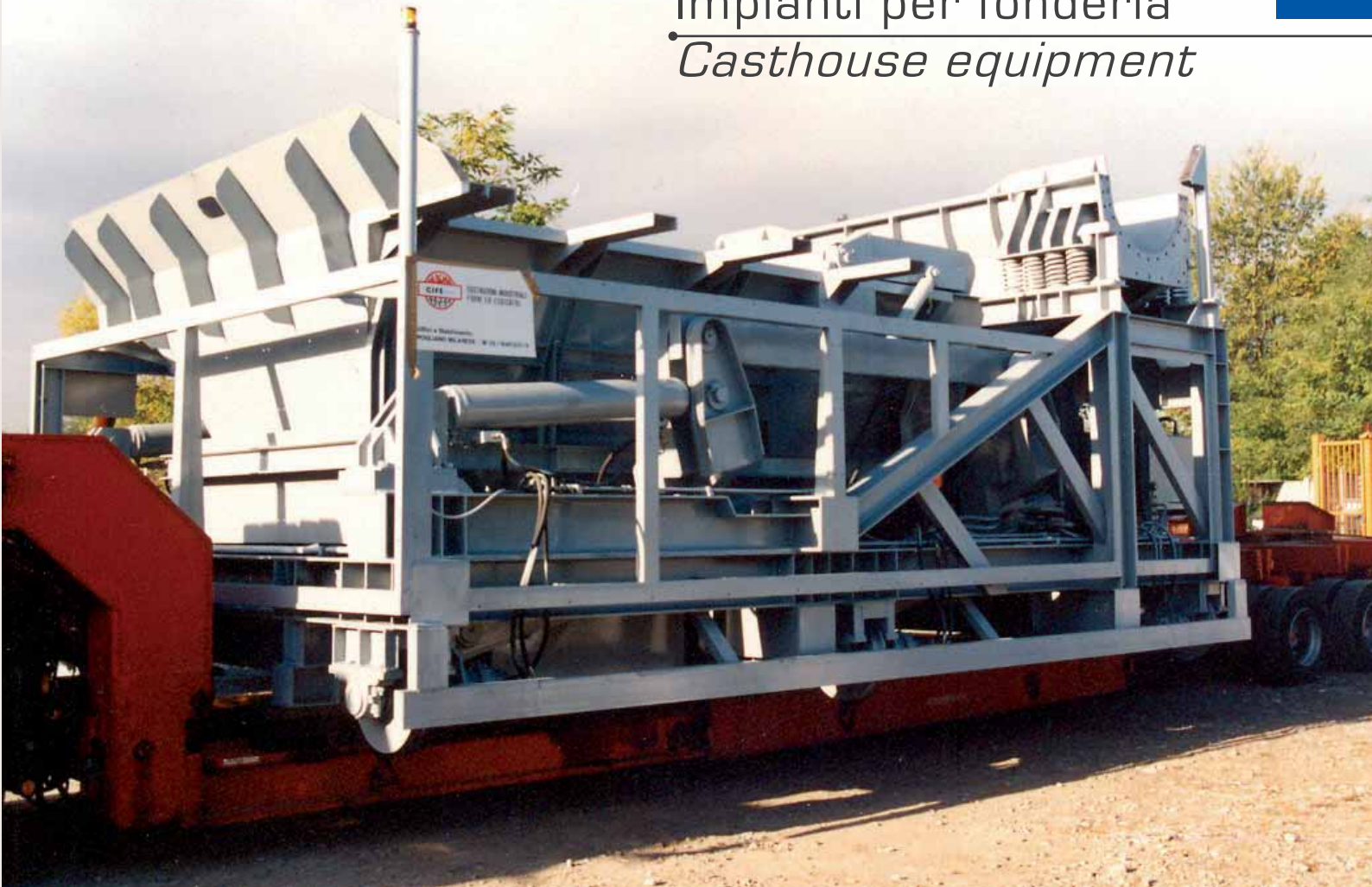
Caricatrici rottami per forni fusori Scraps charging machines for melting furnaces