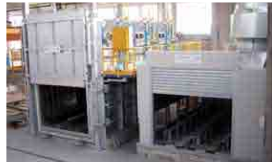
Linea di taglio e omogeneizzazione billette Completa homogenizing center