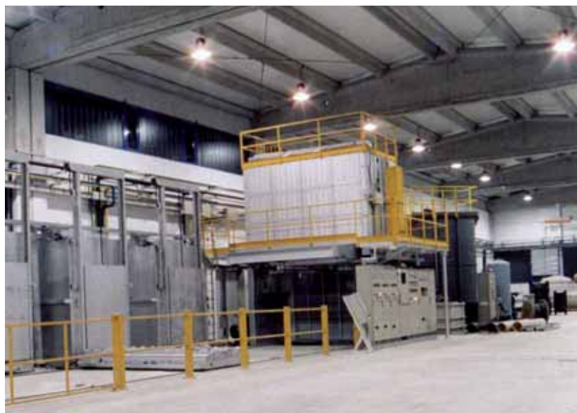
Linea solubilizzazione per alluminio Solubilization plant for aluminium