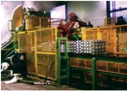
Pallettizzatori automatici per lingotti e billette Automatic stacker for ingots and logs