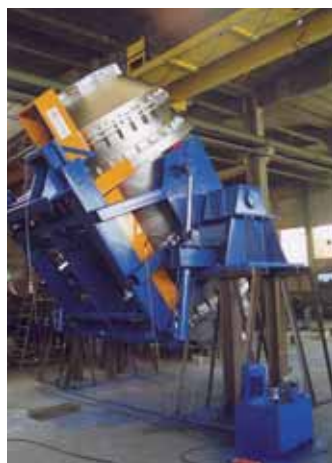
Forni rotativi fissi e ribaltabili per ghisa e metalli non ferrosi fino a 50t Fixed and tilting Rotary furnaces for cast irons and non ferrous metals up to 50ton