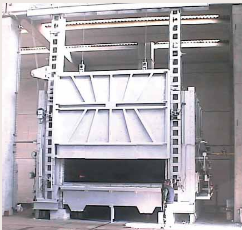
Forno solubilizzazione ghisa 900°C Solubilization furnace for cast iron 900°C